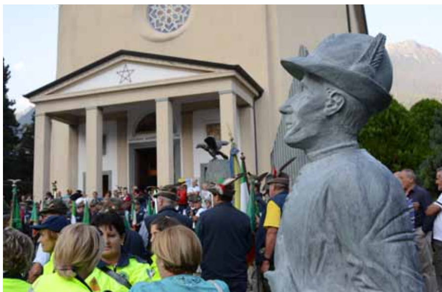
La statua del beato don Carlo Gnocchi ( 1902 – 1956 ) che come cappellano ha conosciuto tanti Alpini valtellinesi nella tragica campagna di Russia ( 1942/1943 ), accoglie i fedeli al loro ingresso al santuario della Madonna degli Alpini.