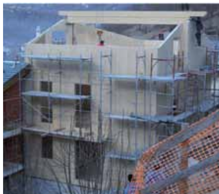
Prima Edificio residenziale in Valmalenco (2012)