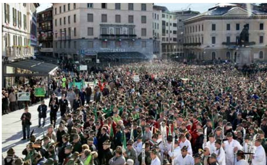
La piazza Garibaldi gremita di "Penne Nere" in occasione del Secondo Raggruppamento - 23 Ottobre 2012

Nel segno dei padri fondatori, dei Reduci, dei valori incarnati dalla solidarietà, amicizia, coesione associativa la Sezione ANA Valtellinese marcia sul sentiero ben tracciato: una continuità espressa dal motto dei giovani... dal 1919... l'impegno continua!