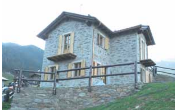
Baita in Valmalenco (2011)