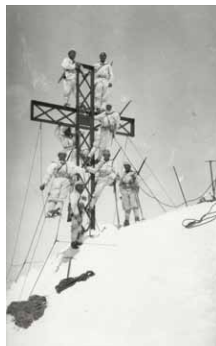
Gli Alpini al presidio del rifugio Marinelli (mt 2813)